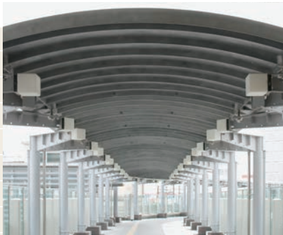
クリアー樹脂塗装品