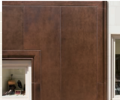
ウレタン樹脂塗装品