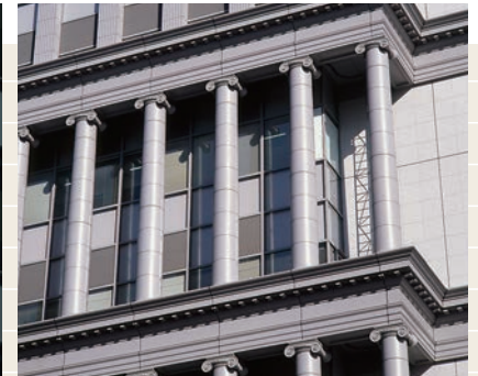
ふっ素樹脂塗装品