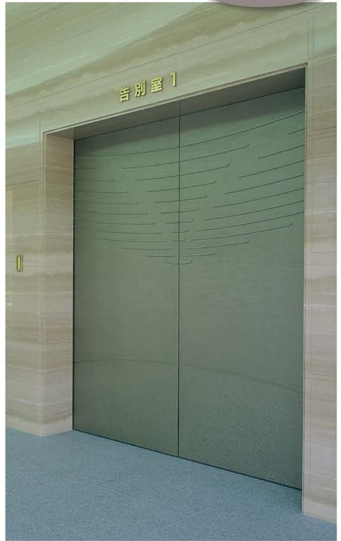
出雲市斎場 | 設計/田中建築事務所 施工/出雲土建・今岡建築JV 所在地/島根県出雲市