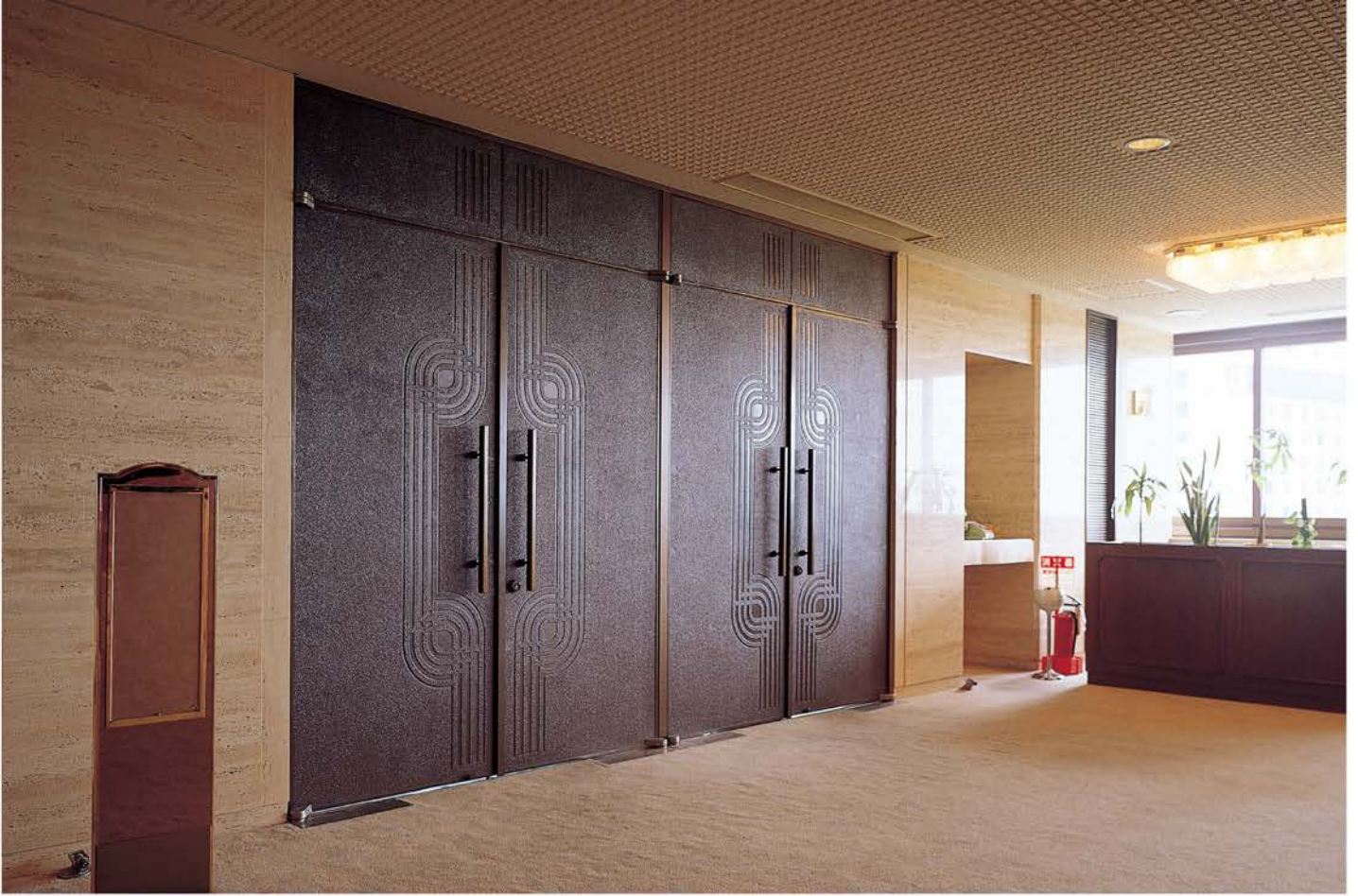
富山県民会館 | 所在地/富山県富山市