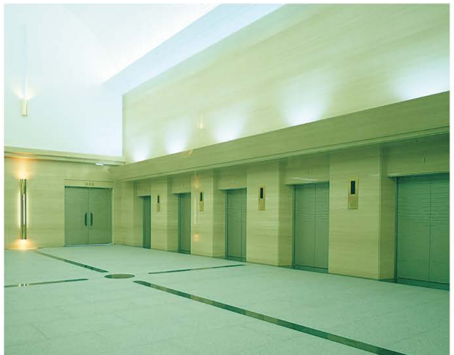
出雲市斎場 | 設計/田中建築事務所 施工/出雲土建・今岡建築JV 所在地/島根県出雲市