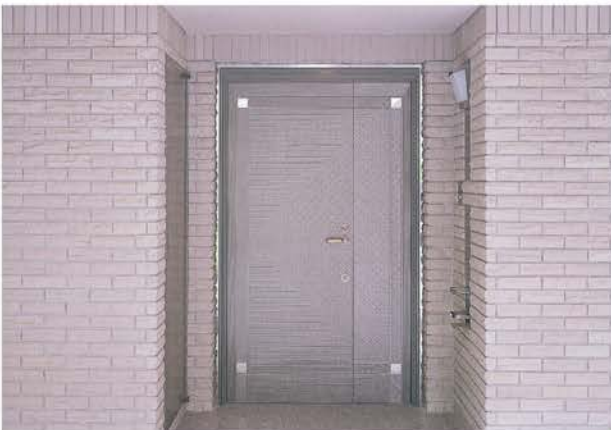
御所東アーバンライフ | 設 計/竹中工務店 施 工/竹中工務店 所在地/京都府京都市