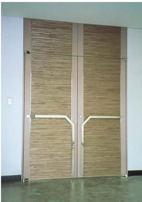
森精機 | 設計/服部都市建築設計事務所 施工/浅沼組 所在地/三重県伊賀市