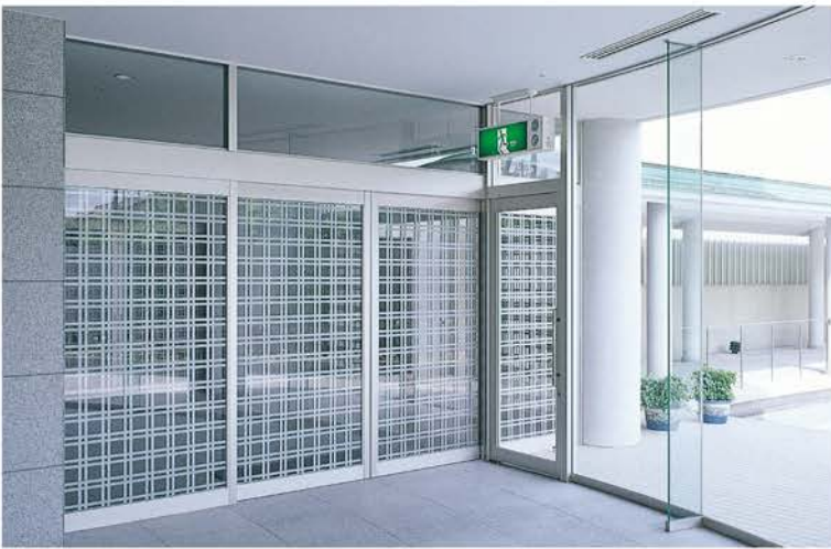
あたかや佳水郷 | 設 計/河合徳治建築事務所 施 工/熊谷組 所在地/石川県加賀市