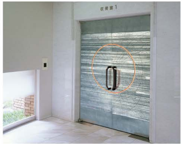
東広島聖苑 | 設 計/大旗連合建築設計 施 工/鉄建・日興・堀田組JV 所在地/広島県東広島市