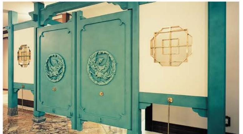
栄ガスビル(百楽酒家) | 設 計/青島設計 施 工/竹中工務店 所在地/愛知県名古屋市