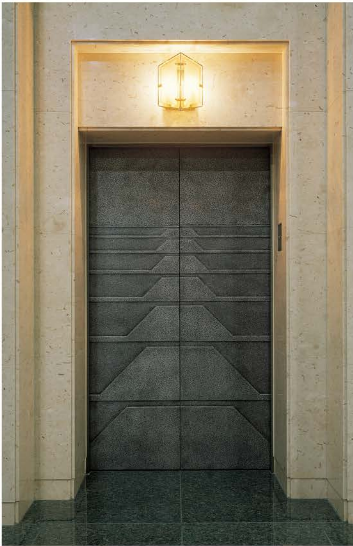
瀬戸市斎場・火葬場建築 | 設計/岡設計 施工/鴻池・信和建設工事JV 所在地/愛知県瀬戸市