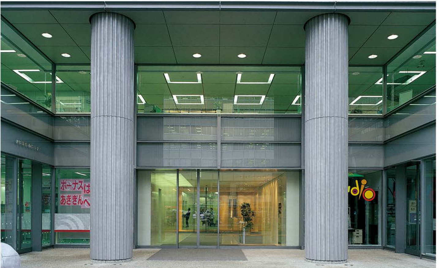
素地仕様 ショットプラスチック仕上げ