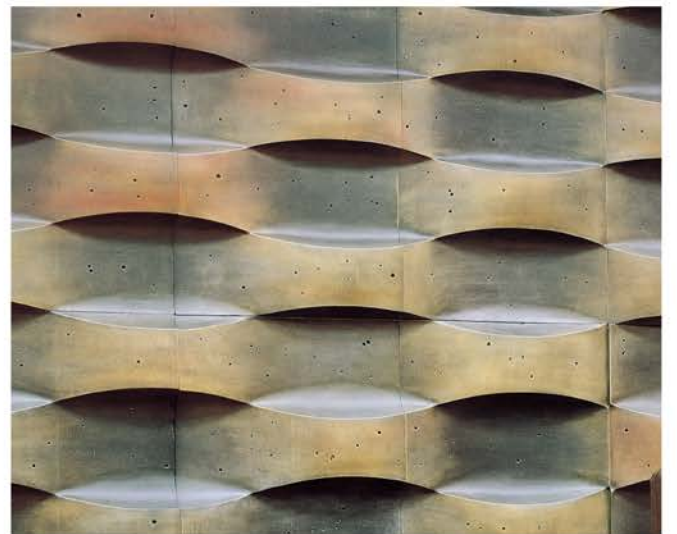
福岡町庁舎 | 設計 / 中川建築設計事務所 施工 / 大成建設JV 所在地 / 富山県高岡市福岡町