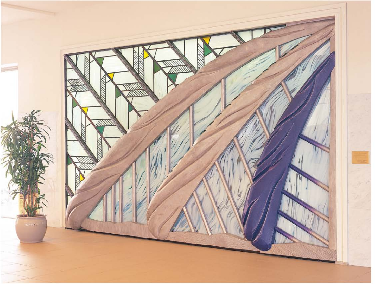
福岡町文化ホール | 設計 / 安井建築設計事務所・中川建築設計事務所JV 所在地 / 富山県高岡市福岡町