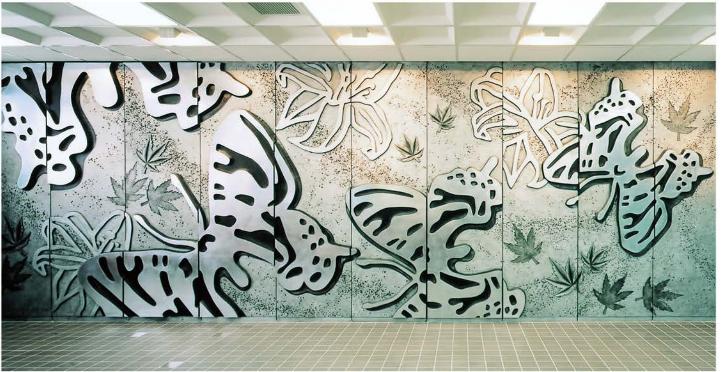
金山町役場 | 設計/大建設計 施工/ハザマ・金山・マスマヤマJV 所在地/岐阜県益田郡金山町